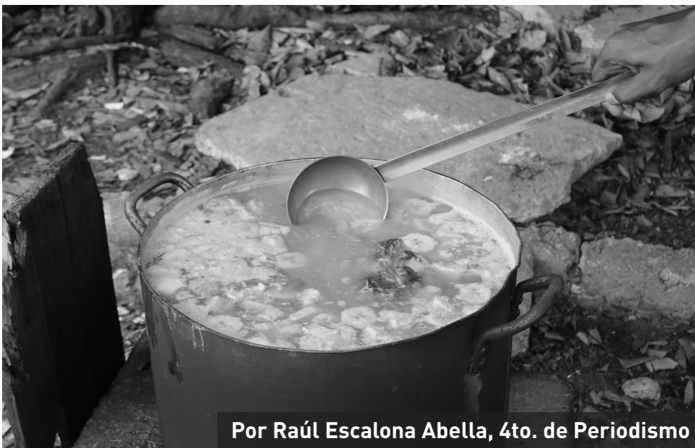
Por Raúl Escalona Abella, 4to. de Periodismo

¿Qué imaginaba yo qué era la universidad antes de entrar? Es complejo decirlo ahora. Contaminada la mente con lo vivido se hace difícil recordar un pensamiento anterior que no esté “tocado” por lo más reciente, es casi imposible sacar del pozo una gota que sobreviva impoluta a la experiencia de tres años en la Universidad de La Habana. Las cosas importantes, y los recuerdos notables siempre regresan en momentos cruciales que los atraen. Quizás muchos pudieran pensar que la Universidad soñada es la que en los pasillos se escucha a Bach, a Mozart, a Beethoven, o